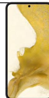
Samsung S23 FE 5G 128GB 0 EUR