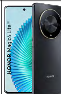
Honor Magic6 LITE 256GB 0 EUR