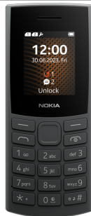
Nokia 105 4G DUAL SIM 0 EUR

Posibilitatea achizitiei unui telefon prin cumularea a 2/3/4 abonamente (valoarea de baza: 5 /7.9 /12.9 /19.5 / 30 / 4EUR) Pentru telefoanele premium (ex. Samsung S sau Note, Iphone) este necesara precomanda la Orange, ulterior se primeste confirmarea de rezervare si termenul estimat de livrare