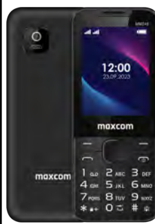
Maxcom MM 248 4G 0 EUR

** Zone dedicate de Roaming Roaming ZONA A: Turcia, Elvetia, Moldova, Serbia, Montenegro, Ucraina, SUA, Israel, China, Rusia, Marea Britanie (Anglia, Tara Galilor, Scotia si Irlanda de Nord) si Gibraltar Roaming ZONA B: Australia, Belarus, Thailanda, Japonia, Mexic, atar, Canada, Sri Lanka Roaming ZONA C: Restul lumii - nu sunt incluse zonele Roaming in avion si Roaming maritim Consum: Apel primit/initiat/SMS in Zona A: 1 unitate / Apel primit/initiat/SMS in Zona B: 2 unitati / Apel primit/initiat/SMS in Zona C: 4 unitati. Apel initiat din Zona SEE catre zonele A - C: 1 unitate Consum 1 MB in Zona A: 1 unitate / Consum 1 MB in Zona B: 2 unitati / Consum 1 MB in Zona C 4 unitati SEE Spatiul Economic European compus din statele membre ale Uniunii Europene, Islanda, Lichtenstein si Norvegia. Detalii despre zonele de tarificare roaming pe www.orange.ro . In tarile non-membre UE are loc tarificarea traficului Internet: Serbia / Macedonia Moldova / Elvetia / etc.