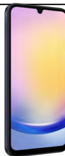
Samsung A25 5G 128 GB 0 EUR