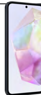
Samsung A35 5G 128GB 0 EUR