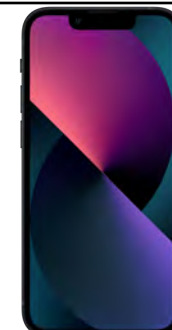
iPhone 13 128 GB 0 EUR