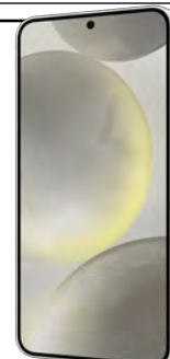
Samsung S24 5G 256GB 0 EUR

** Zone dedicate de Roaming Roaming ZONA A: Turcia, Elvetia, Moldova, Serbia, Montenegro, Ucraina, SUA, Israel, China, Rusia, Marea Britanie (Anglia, Tara Galilor, Scotia si Irlanda de Nord) si Gibraltar Roaming ZONA B: Australia, Belarus, Thailanda, Japonia, Mexic, atar, Canada, Sri Lanka Roaming ZONA C: Restul lumii - nu sunt incluse zonele Roaming in avion si Roaming maritim Consum: Apel primit/initiat/SMS in Zona A: 1 unitate / Apel primit/initiat/SMS in Zona B: 2 unitati / Apel primit/initiat/SMS in Zona C: 4 unitati. Apel initiat din Zona SEE catre zonele A - C: 1 unitate Consum 1 MB in Zona A: 1 unitate / Consum 1 MB in Zona B: 2 unitati / Consum 1 MB in Zona C 4 unitati SEE Spatiul Economic European compus din statele membre ale Uniunii Europene, Islanda, Lichtenstein si Norvegia. Detalii despre zonele de tarificare roaming pe www.orange.ro . In tarile non-membre UE are loc tarificarea traficului Internet: Serbia / Macedonia Moldova / Elvetia / etc.