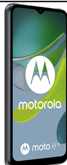
Motorola Moto E13 0 EUR