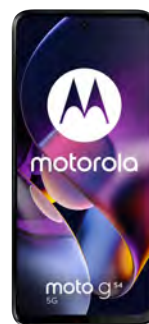
Motorola G54 5G 256GB 0 EUR