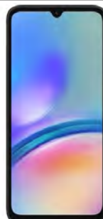
Samsung GalaxyA05 64GB 27.73 EUR