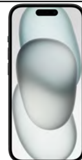
iPhone 15 256 GB 0 EUR