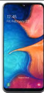
Samsung Galaxy A13 11.76 EUR