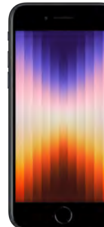
iPhone SE 64GB 0 EUR