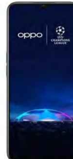
Oppo A17 4GB 64GB 39.5 EUR