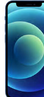
iPhone 13 128GB 0 EUR