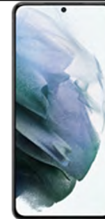
Samsung S21FE 5G 128GB 18.49 EUR