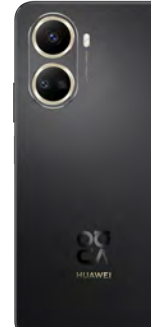
Huawei Nova 10SE 128GB 0 EUR