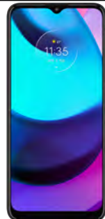
Motorola E20 32GB 45.38 EUR

Pentru telefoanele premium (ex. Samsung S sau Note, Iphone) este necesara precomanda la Orange, ulterior se primeste confirmarea de rezervare si termenul estimat de livrare