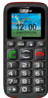
Maxcom MM 428 0 EUR

Detalii despre zonele de tarificare roaming pe www.orange.ro . In tarile non-membre UE are loc tarificarea traficului Internet: Serbia / Macedonia Moldova / Elvetia / etc.