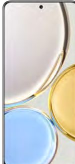
Honor Magic 4 LITE 29.41 EUR