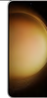
Samsung S23 5G 128GB 17.65 EUR