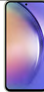
Samsung A54 5G 256GB 27.73 EUR