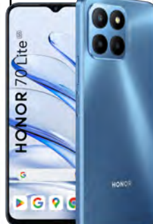
Honor 70 lite 5G 0 EUR