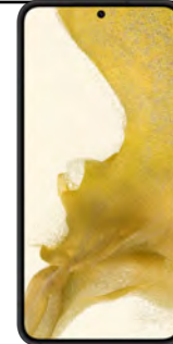
Samsung S22 5G 128GB 5.88 EUR