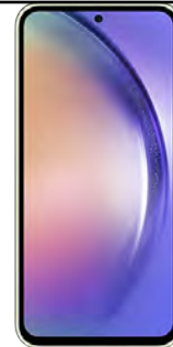
Samsung A54 5G 128GB 0 EUR