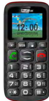
Maxcom MM 428 0 EUR

Detalii despre zonele de tarificare roaming pe www.orange.ro . In tarile non-membre UE are loc tarificarea traficului Internet: Serbia / Macedonia Moldova / Elvetia / etc.