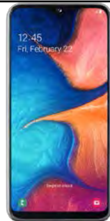
Samsung Galaxy A04 19.33 EUR