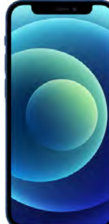
iPhone 13 128GB 0 EUR