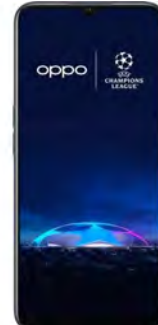
Oppo A17 4GB 64GB 27.73 EUR