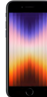
iPhone SE 64GB 0 EUR