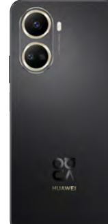
Huawei Nova 10SE 128GB 0 EUR