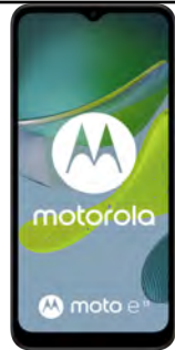
Motorola E13 64GB 46.22 EUR

Pentru telefoanele premium (ex. Samsung S sau Note, Iphone) este necesara precomanda la Orange, ulterior se primeste confirmarea de rezervare si termenul estimat de livrare